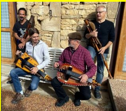
Carré de 2