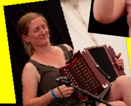
Air de Famille